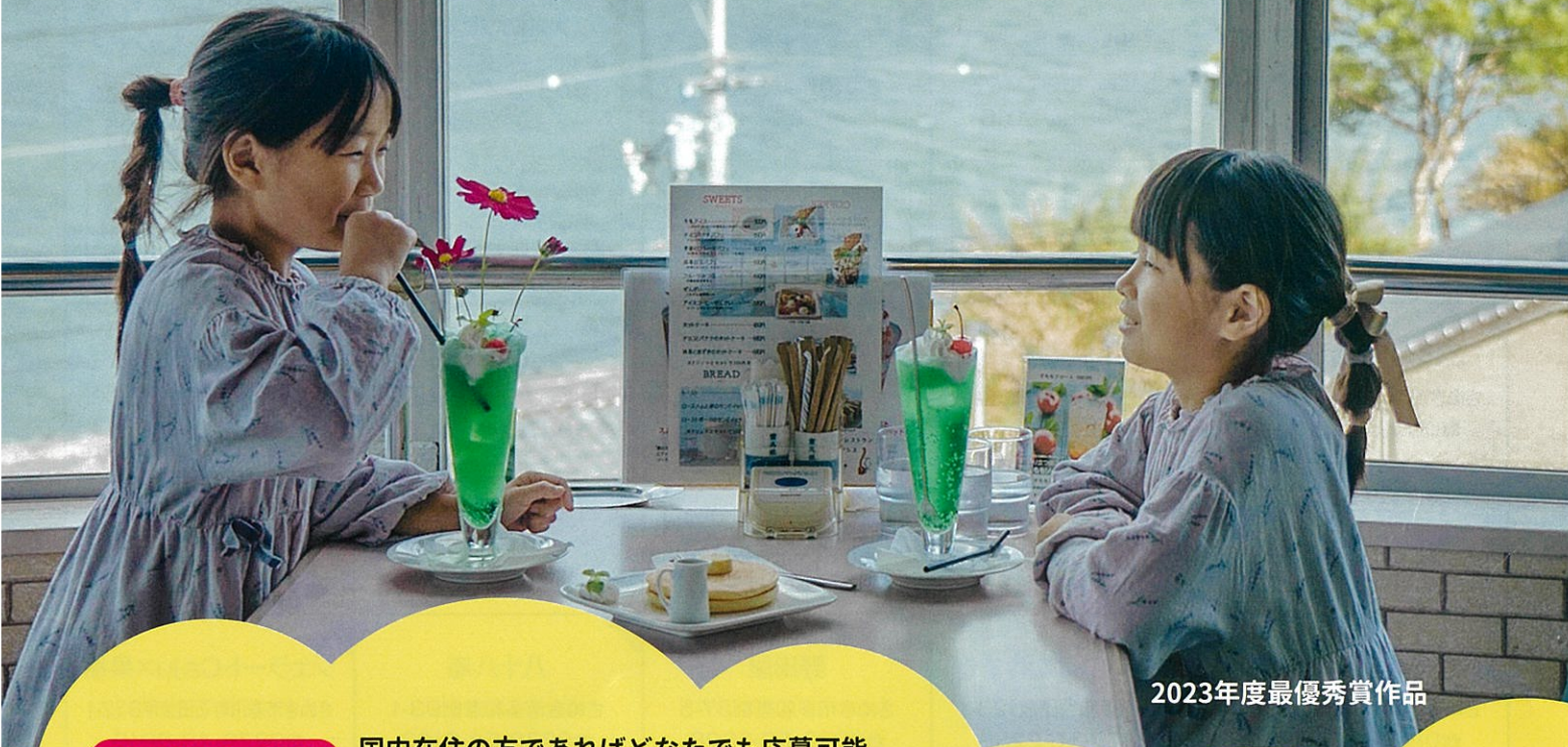
2023年度最優秀賞作品